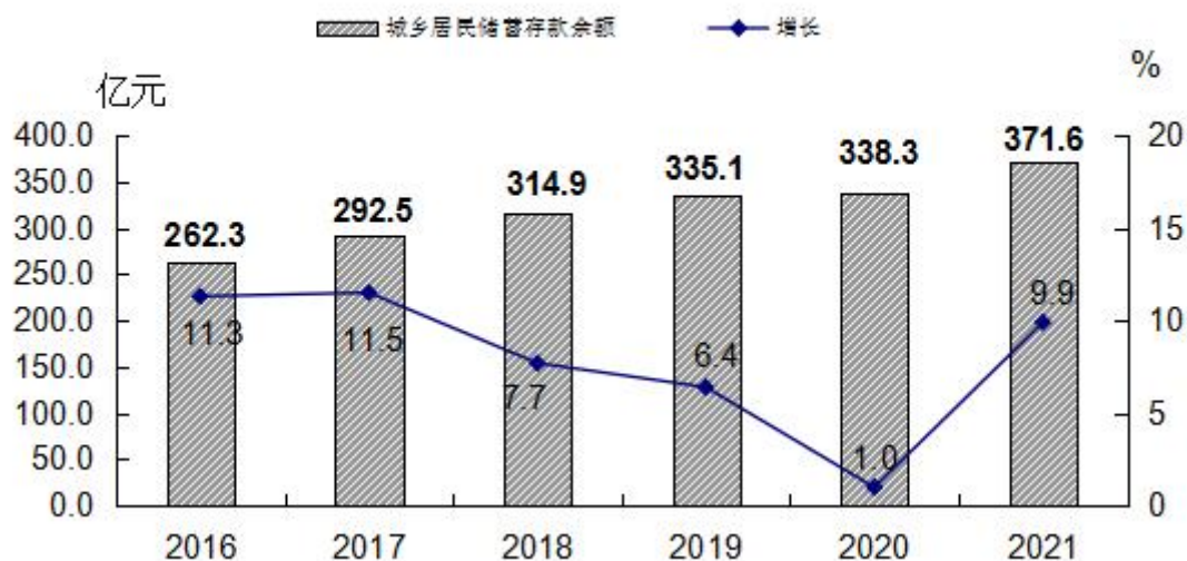
图 5 2016-2021年城乡居民储蓄存款余额及其增长速度