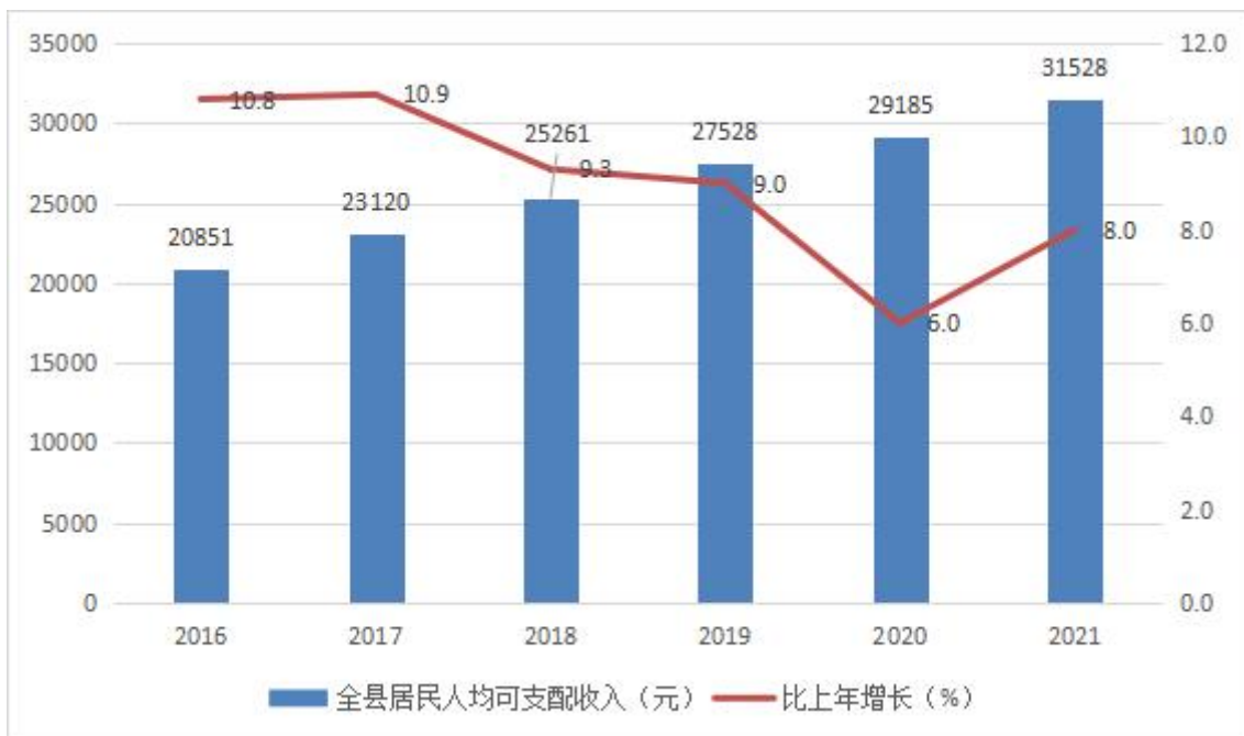
图 6 2016-2021 年惠东居民人均可支配收入及增长速度

全年惠东居民人均消费支出 21079 元，比上年增长 13.6%。分城乡看，城镇居民人均消费支出 21890 元，增长 12.1%；农村居民人均消费支出 19687 元，增长 15.6%。全县居民恩格尔系数为 37.3%，比上年下降 0.5 个百分点，其中城镇为 37.3%、农村为 37.3%。