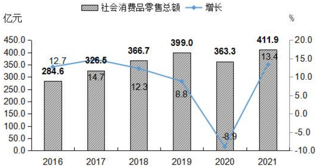
图 4 2016-2021年社会消费品零售总额